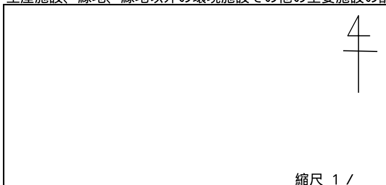
生産施設、緑地、緑地以外の環境施設その他の主要施設の配置図