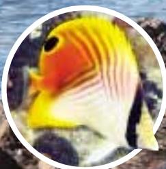
トゲチョウチョウウオ